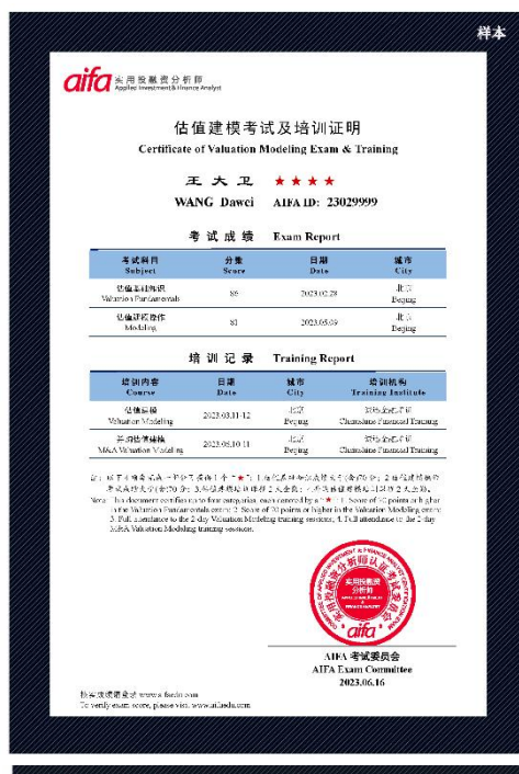
估值建模考试及培训证明